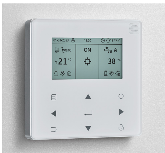
Obslužný terminál: nastavení celého systému v 16 jazycích. Po instalaci v obytném prostoru lze použít také jako termostat.

Další věc, na kterou nemusíte myslet: po nastavení regulátor Belaria® fit automaticky zajistí správnou teplotu v místnostech a také ohřev teplé vody. Automaticky vytápí nebo chladí v závislosti na venkovní a vnitřní teplotě.