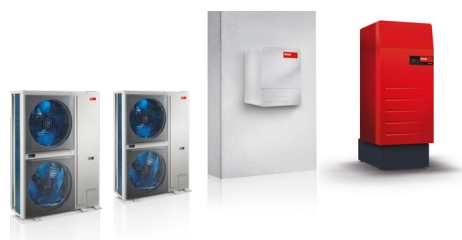
Belaria® se hodí do bivalentních systémů s kondenzačním kotlem TopGas® nebo UltraGas®, a regulátorem systému TopTronic® E