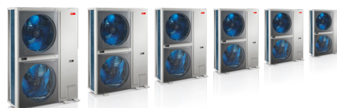
Kaskáda složená ze 6 zařízení Belaria® fit poskytuje až 150 kW tepelného nebo chladicího výkonu.

System Belaria® fit (8-26) se neomezuje pouze na rodinné domy. Hravě zvládne i systémy s vyššími nároky a díky kaskádovému zapojení dodává až 150 kW tepelného nebo chladicího výkonu - což je dostatečné pro bytové domy, malé hotely nebo průmysl. Celkový výkon lze ještě zvýšit v bivalentních systémech, např. s plynovými kondenzačními kotli. Belaria® fit zde pokrývá základní potřebu tepla. Bivalentní zdroj tepla dodává energii pouze pro odběrové špičky, při nízkých venkovních teplotách nebo zvýšené potřebě užitkové vody. Celý systém je řízen systémovou regulací Hoval TopTronic® E.